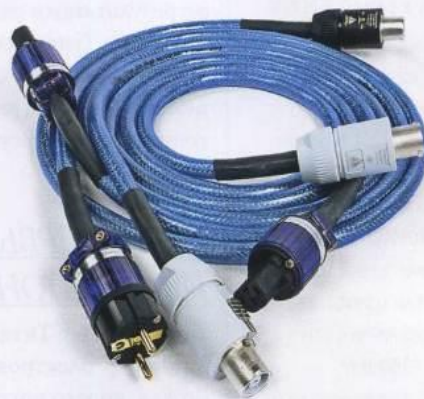
Кабель для подключения кондиционера к электрической сети. Кабели для подключения потребителей к кондиционеру.

понять, будет ли заметно присутствие в тракте фильтра на недорогих акустических системах. Оказалось, что все вышеописанное справедливо и для этих колонок.